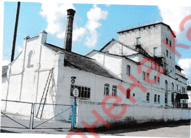
18.2. Будынак спіртзавода (2019 г.)