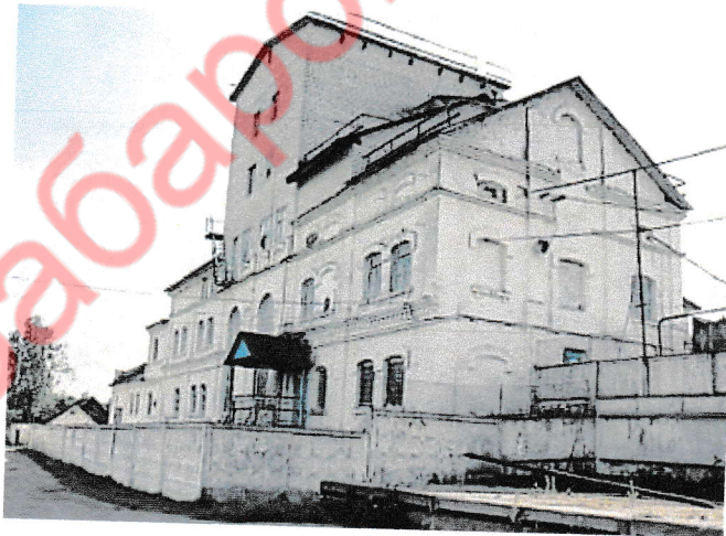
18.3. Будынак спіртзавода (2019 г.)