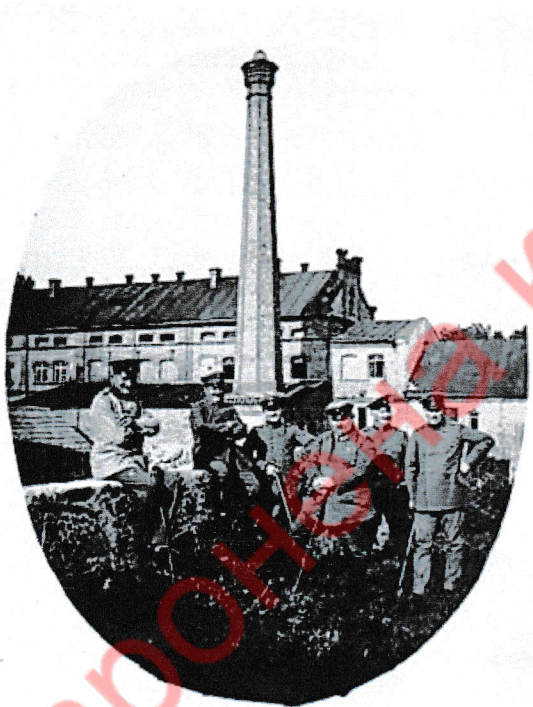
18.5. Нямецкія салдаты перад спіртзаводам у Жамыслаўлі ў 1918 г.