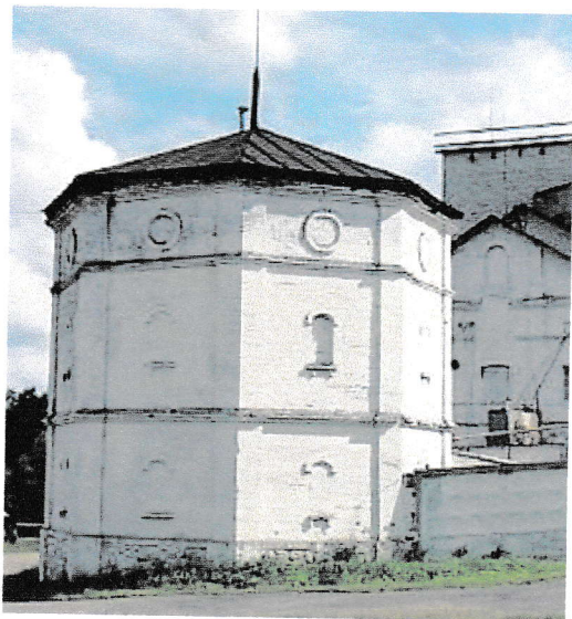
18.4. Будынак спіртзавода (2019 г.)